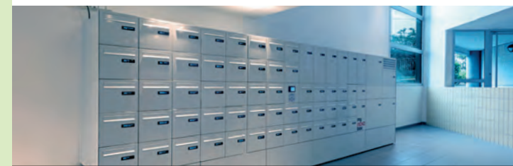
Toit et Joie se félicite du partenariat entrepris avec Renz et de pouvoir entamer une nouvelle expérimentation. Cette démarche innovante a réellement satisfait les locataires, qui ont pu y voir un réel atout notamment au niveau de la praticité et du gain de temps considérable.