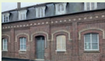
Étrépagny avant travaux.