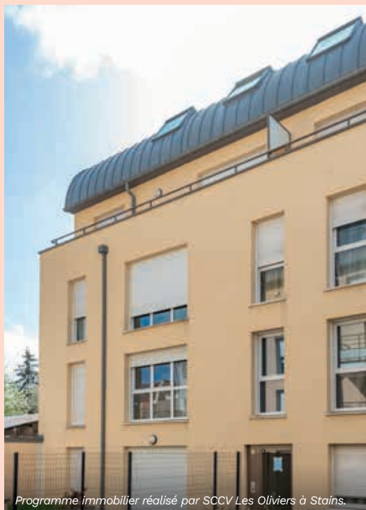
Programme immobilier réalisé par SCCV Les Oliviers à Stains.

Logés dans un appartement du T2 au T5 entre 44 et 114 m 2 , les locataires disposent d'un balcon ou d'un jardin privatif.