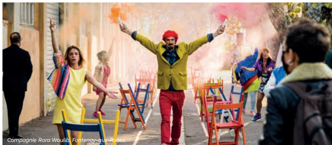
Compagnie Rara Woulib, Fontenay-aux-Roses.

Les locataires peuvent aussi être à l'initiative de projets.