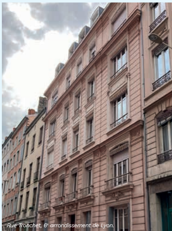
Rue Tronchet, 6 e arrondissement de Lyon.