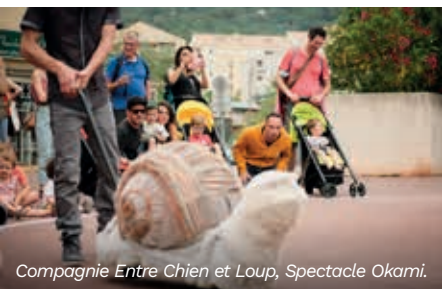
Compagnie Entre Chien et Loup, Spectacle Okami.

Le Groupe Poste Habitat développe depuis plusieurs années des projets culturels dans ses résidences, avec des compagnies artistiques professionnelles et ses habitants. Pour la première fois, Poste Habitat propose un projet d'envergure au long cours pour tous les locataires de Carros. Ils seront invités par la Compagnie Entre Chien et Loup, à partir d'octobre 2023 puis tout au long de l'année, à participer à un projet artistique et culturel en pied d'immeuble : un spectacle dans l'espace public mêlant plusieurs disciplines : scénographie, environnement sonore, recueil de témoignages.