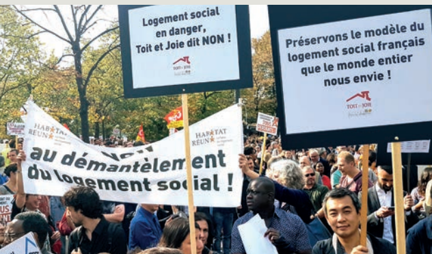
Manifestation du 17/10/2017 aux Invalides